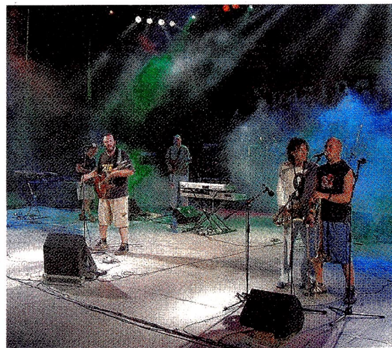
LIVE Gli Pseudofonia durante un concerto